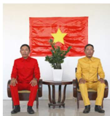
© Snežana Golubović, Thread of Life, 2014, photo: Milivoj Mijodukić